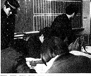
編集部書記の勤務風景

編集後記 編集部書記の勤務風景 編集後記 編集部書記の勤務風景 編集後記 編集部書記の勤務風景