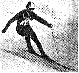
迫力あるスキュー競技

内容のある新聞を 出版部の巻 内容のある新聞を 出版部の巻 内容のある新聞を 出版部の巻