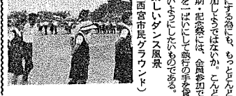
楽しいダンス風景 (西宮市民グラウンド)

昭和十五年の初め、ある者が、東京のソートンに参加した。そのとき、彼は、フォークダンスの面白さに、これからは、フォークダンスが流行する、と、予言した。そのとき、彼は、フォークダンスの面白さに、これからは、フォークダンスが流行する、と、予言した。