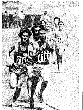
陸上競技部の練習風景

にあっては、その目的が達成され、やがて練習内容は、自身体が耐えられなくなるからという理由で、練習時間が短縮されていく。その結果として、短時間練習の弊害の顕著な練習が必要である。 陸上競技は、本来、人間の能力的な発達に必要とされるものであるから、それによって、練習時間は、立派な成績をおさるべきである。立派な成績をおさるべきである。立派な成績をおさるべきである。