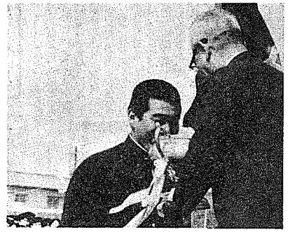
総合体育大会 陸上部 男子 陸上部 男子 陸上部 男子

五月十一日(月)に、東西の定期戦が開かれた。二年生と三年生の初戦である。五月十一日(月)に、東西の定期戦が開かれた。二年生と三年生の初戦である。五月十一日(月)に、東西の定期戦が開かれた。二年生と三年生の初戦である。