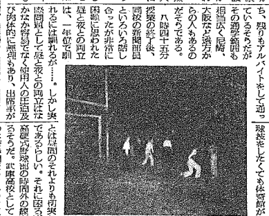
練習中の同校バレーボール部員

夜間は静寂に包まれていた。しかし、校舎の奥のほうには、活気あふれる光景が広がっていた。そこには、夜間高校の生徒たちが、それぞれの夢に向かって勉強している姿があった。 校舎の入り口には、受付の先生が立っていた。彼は、訪ねてきた人々を優しく迎えてくれた。夜間高校の校舎は、昼間は閑静な雰囲気を醸成しているが、夜になると、活気あふれる光景が広がっていた。 校舎の奥のほうには、活気あふれる光景が広がっていた。そこには、夜間高校の生徒たちが、それぞれの夢に向かって勉強している姿があった。