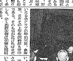
夜間高校の生徒たち

この号は、夜間高校の生徒たちの生活と勉強の様子を詳しく紹介しています。彼らの努力と情熱は、周囲の人々を感動させています。夜間高校の校舎は、昼間は閑静な雰囲気を醸成しているが、夜になると、活気あふれる光景が広がっています。