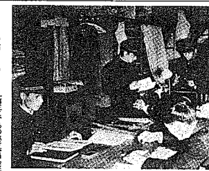
なごやかな雰囲気での執行委員会